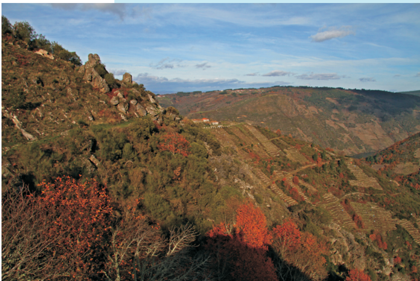
San Lourenzo de Barxacova, punto final da ruta, desde o alto da pena de San Vitor.