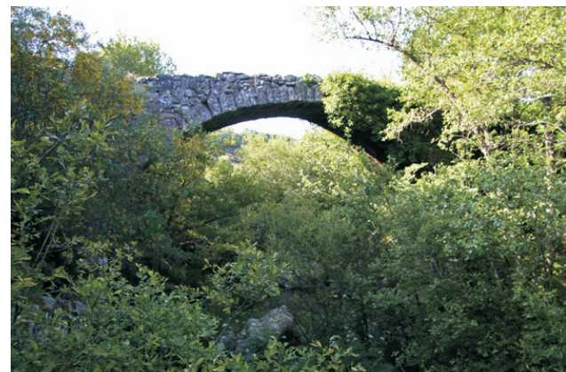
Ponte de Conceliños