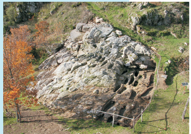
Necrópole medieval de San Vitor