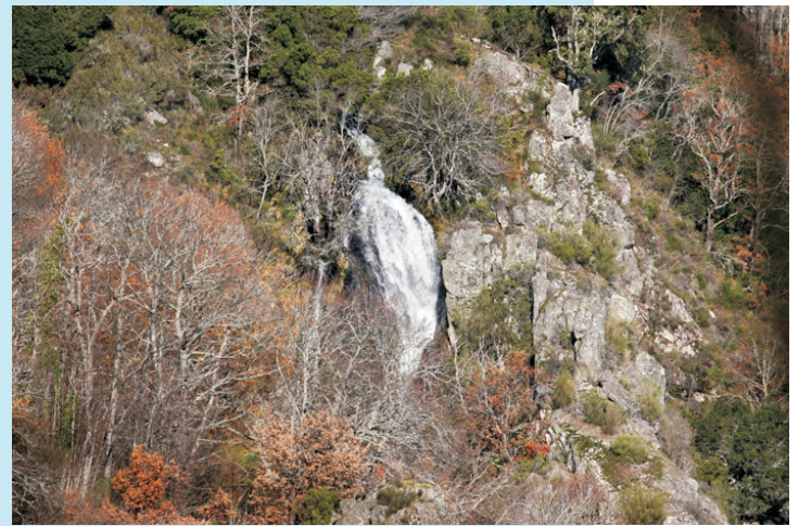
Ferveza no rego da Senra. Baixa ao canón desde o lugar da Senra formando numerosos saltos e fervezas. A máis importante (duns 20 m de altura) vese de lonxe.